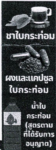
ชาใบกระท่อม