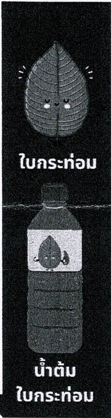
ใบกระท่อม